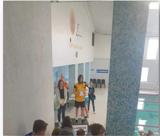
Фото 8. Награждение