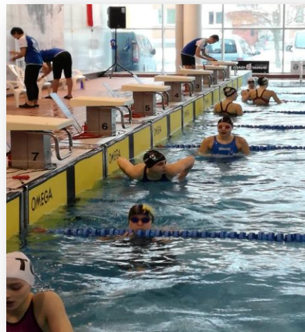
Фото 5. Финиш