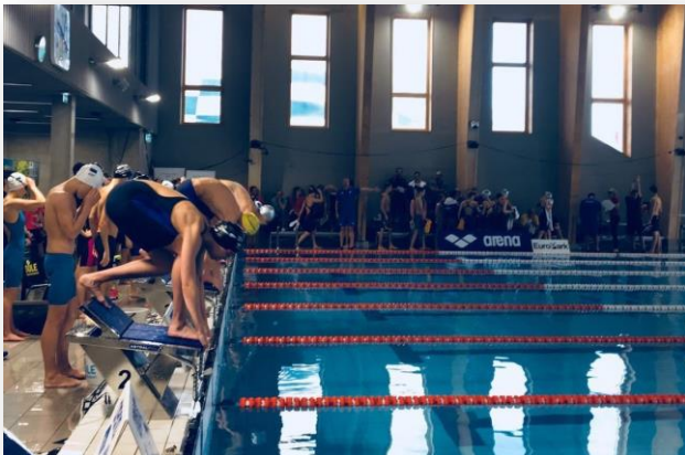
Фото 4. Старт