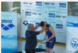
Фото 6. Фото из семейного альбома