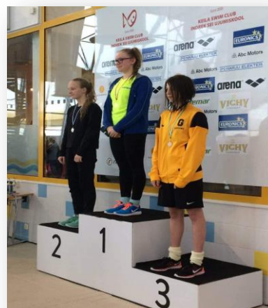
Фото 7. Фото из семейного альбома